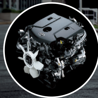
Motor 2.8l de 204 CV de potencia y 500 Nm de torque máximo