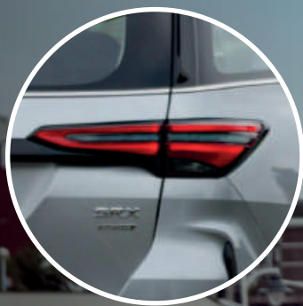
Faros traseros de LED