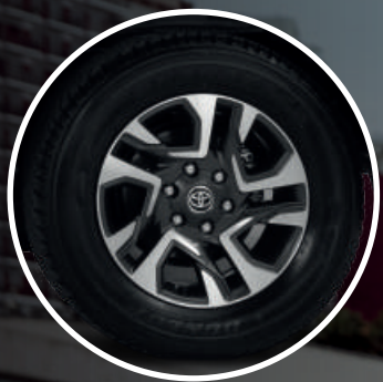
Llantas de aleación de 18"