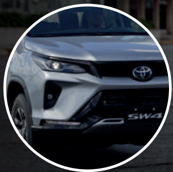
Nuevo diseño frontal y faros delanteros Bi-LED